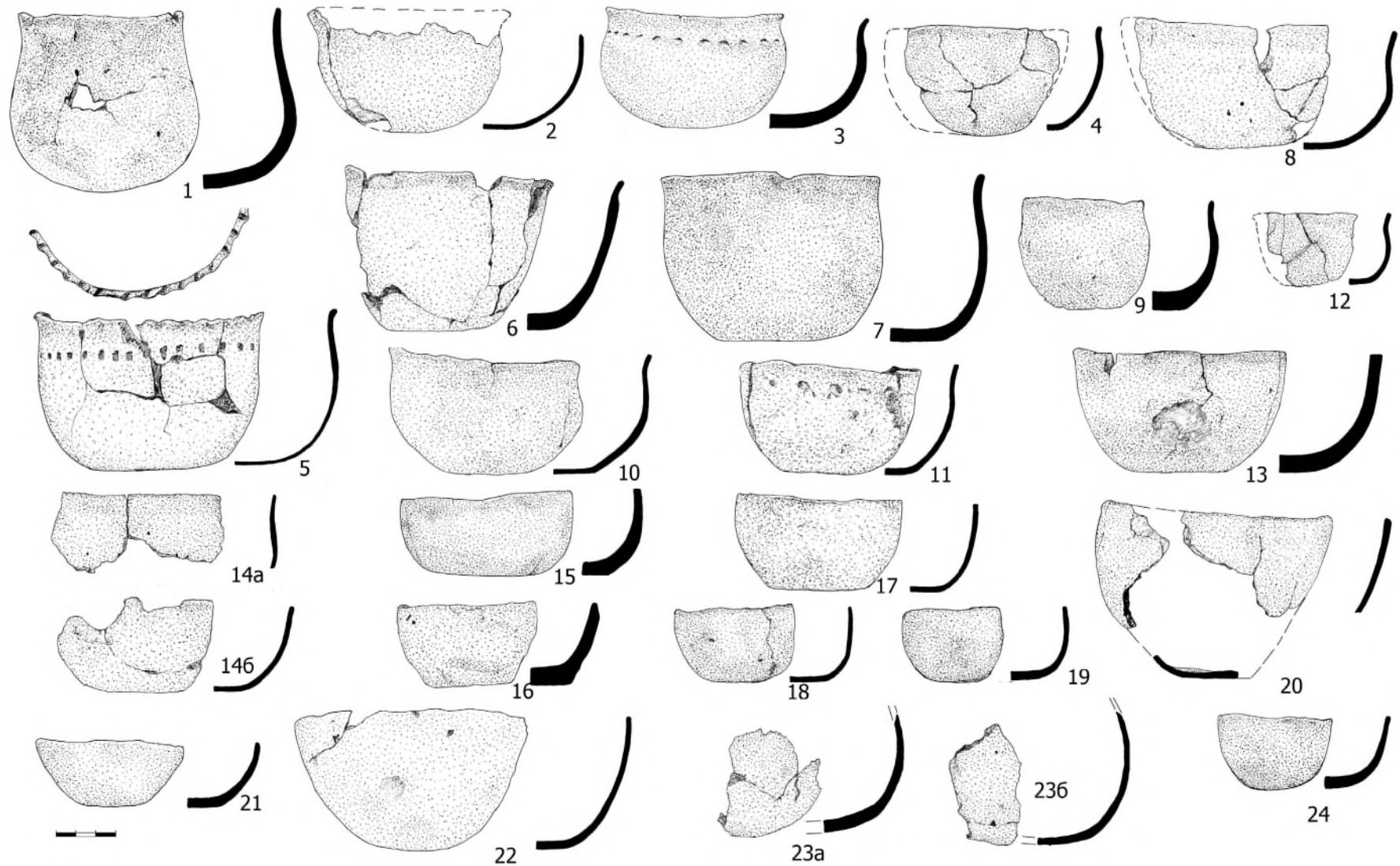
Рис. 2. Сосуды Ново-Сасыкульского могильника (рисунки С.Л. Воробьевой): 1 – погр. 166; 2 – погр. 413; 3 – погр. 155; 4 – погр. 207; 5 – погр. 34; 6, 14а-б – кв. 20/Г; 7, 24 – погр. 215; 8 – погр. 182; 9 – погр. 418; 10 – кв. 7/И; 11 – погр. 22; 12 – погр. 175; 13 – погр. 271; 15 – погр. 224; 16 – погр. 353; 17 – погр. 17; 18 – погр. 385; 19 – погр. 242; 20 – кв. 24/Г; 21 – погр. 134; 22 – погр. 76; 23а-б – данные отсутствуют