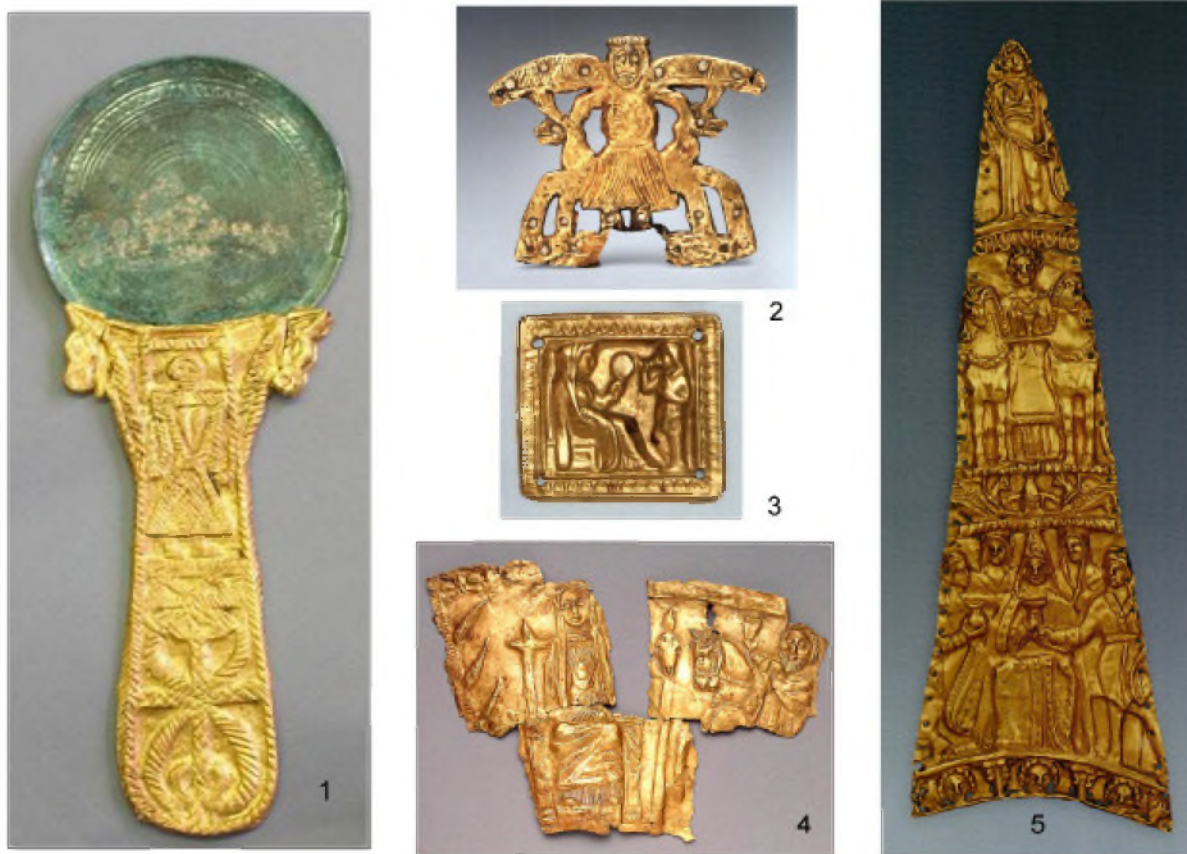
Рис. 2. Изображения «скифской богини»: 1 – бронзовое зеркало с золотой ручкой из кургана Майеровский, Волгоградская обл., II-I вв. до н.э., раскопки Н.Б. Скворцова (по Скворцов, Скрипкин, 2008); 2 – навершие в виде скифской богини из Александропольского кургана (Луговая могила), Приднепровье, IV в. до н.э., основа железо, золото, серебро (по Алексееву, 2012); 3 – золотая бляшка из Чертомлыкского кургана, Приднепровье, IV в. до н.э., раскопки И.Е. Забелина (по Алексееву, 2012); 4 – фрагмент золотой обкладки ритона из кургана Мерджаны, Прикубанье, конец IV – III вв. до н.э., раскопки К.Спира (по Артамонову, 1966); 5 – золотая пластина от женского головного убора из кургана Карагодеуашх, Прикубанье, IV в. до н.э., раскопки Е.Д. Фелицина (по Алексееву, 2012)

Fig. 2. Images of the "Scythian goddess": 1 – a bronze mirror with a gold handle from the Meyerovsky barrow, Volgograd region, II-I centuries BC, excavations of N. Skvortsov (according to Skvortsov, Skripkin, 2008); 2 – top in the form of a Scythian goddess from the Alexandropol mound (Meadow grave), the Dnieper, IV century BC, the base is iron, gold, silver (after Alekseev, 2012); 3 – a gold plaque from the Chertomlyksky barrow, the Dnieper, IV century BC, excavations of I. Zabelin (after Alekseev, 2012); 4 – a fragment of the golden lining of a rhyton from the barrow of Merjan, Kuban, late IV – III centuries BC, excavations of K. Spiro (after Artamonov, 1966); 5 – a gold plate from a female head-dress from the Karagodeuashkh mound, Kuban, IV century BC, excavations of E.D. Felitsin (according to Alekseev, 2012)