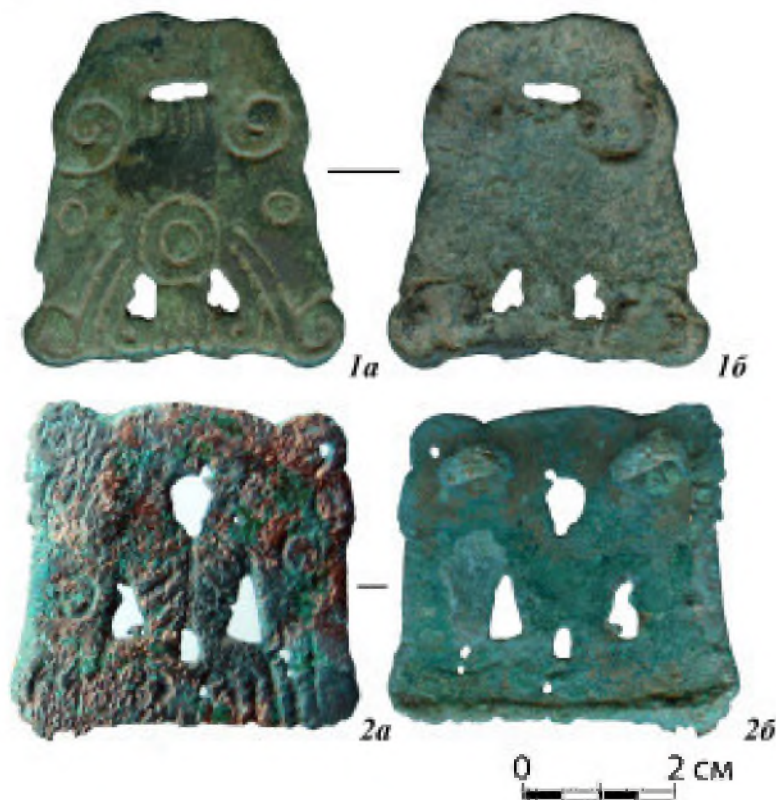
Рис. 1. Зооморфные нашивки: 1 – Кипчаковское городище, подъемный материал; 2 – Шиповский могильник, группа курганов III, раскоп I, погребение 5.